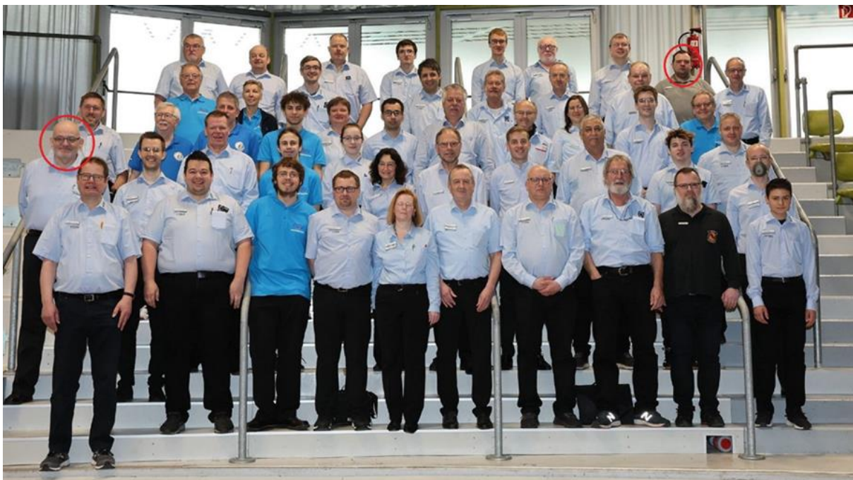
Schiedsrichterteam am Sonntag

Doch nicht nur wegen der Einsätze am Tischtennis-Tisch bleiben solche Veranstaltungen den Schiedsrichtern meist nachhaltig in Erinnerung. Es sind die Erfahrungen und der Meinungsaustausch, die im Schiedsrichteraufenthaltsraum stattfinden. Jeder der Unparteiischen hat Anekdoten aus seiner oft langjährigen Schiedsrichterlaufbahn zu berichten. Auch wie jeder mit auftretenden Problematiken umgeht, ist immer wieder interessant zu hören.