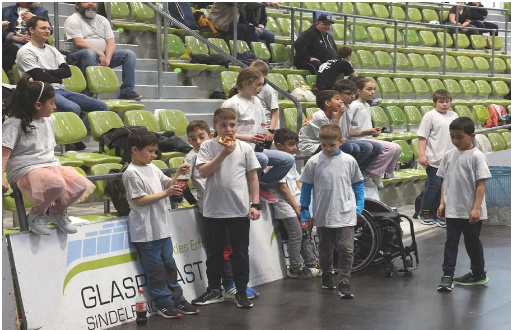
Die Balkkinder hatten sich eine Pause redlich verdient

Ein tolles Engagement was man sich von so manchem erwachsenen Akteur wünschen würde, der sich ja gerne mal beispielsweise vor einem Schiedsrichtereinsatz bei einem Verbandsspiel drückt.